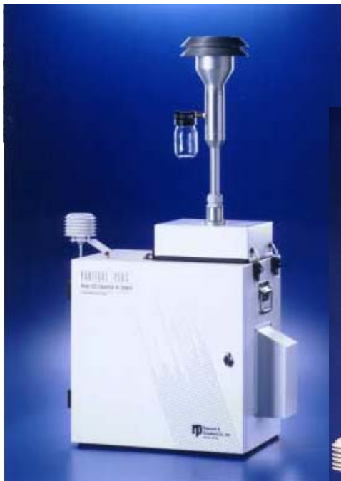
Préleveur Partisol Plus