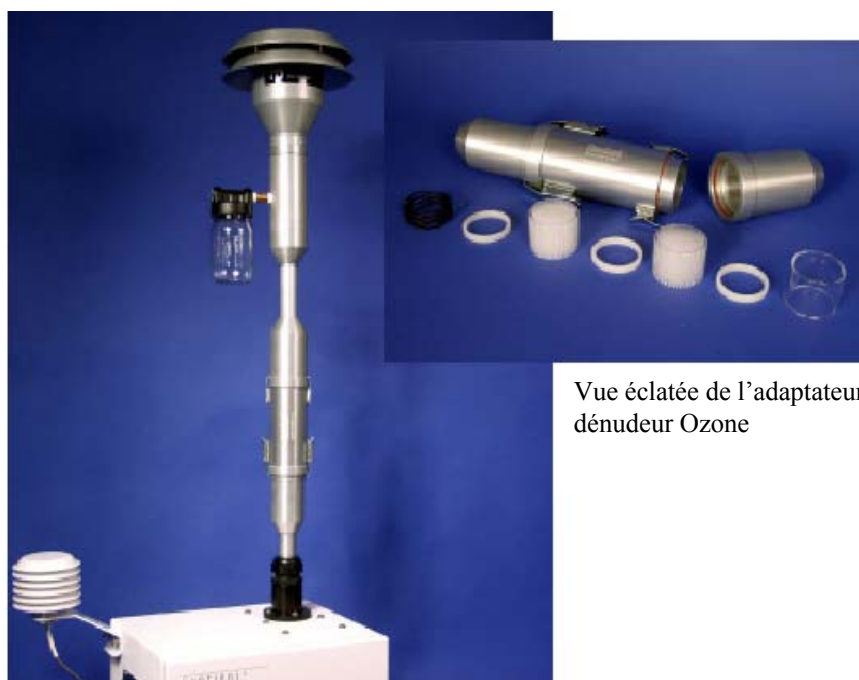
Vue éclatée de l'adaptateur pour dénudeur Ozone

L'installation d'un dénudeur Ozone sur un Partisol Plus est effectuée très simplement au moyen d'un adaptateur « in-line » s'installant sans modification ni outillage sous la tête PM-10 du préleveur. L'adaptateur « in line » peut recevoir une combinaison de 1 à 4 dénudeurs différents, ce qui permet si nécessaire de piéger d'autres gaz que l'Ozone, susceptibles de dégrader le Benzo [a] pyrène.