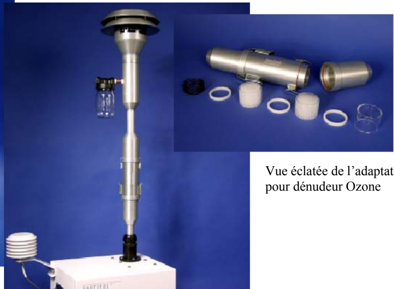
Montage du dénudeur Ozone sur la ligne du préleveur